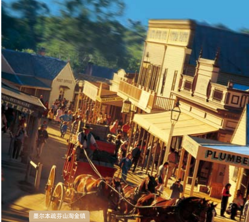
墨尔本疏芬山淘金镇

提取现钞： 您可在遍布全澳的7,000多台ATM机上取款，包括：所有贴有“银联”标识的ATM机；所有澳大利亚国民银行（NAB）旗下的ATM机；所有“Cashcard”旗下的ATM机（包括汇丰银行和7-Eleven便利店内的ATM机）。持银联卡，您可以在您的银行卡额度内每天提取不超过1万元人民币等值的澳元。提现时，相关银行将自动扣除一定金额的手续费。