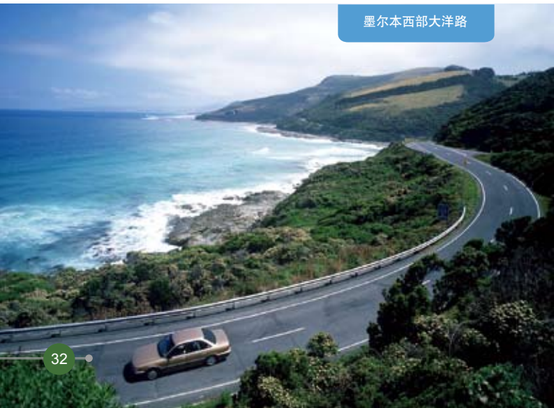
墨尔本西部大洋路

注意：酒后驾车和无证驾驶是一种刑事犯罪，可能被罚款甚至入狱。驾车时使用手机属违法。