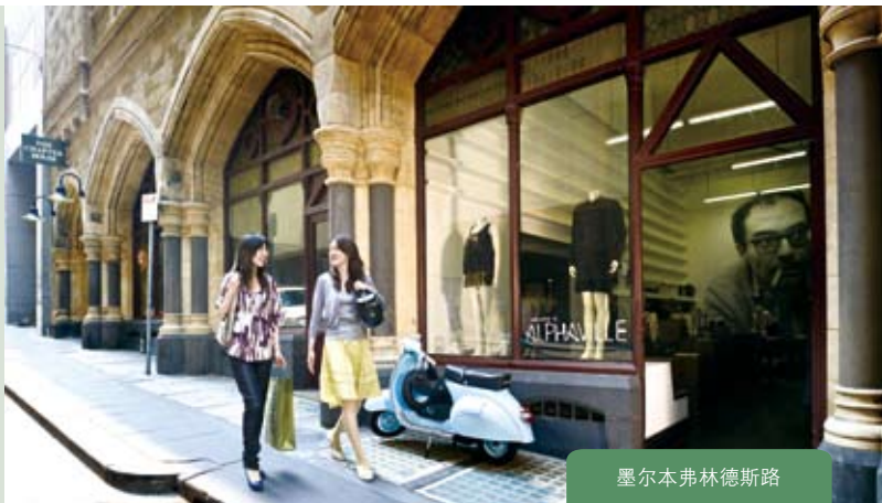
墨尔本弗林德斯路