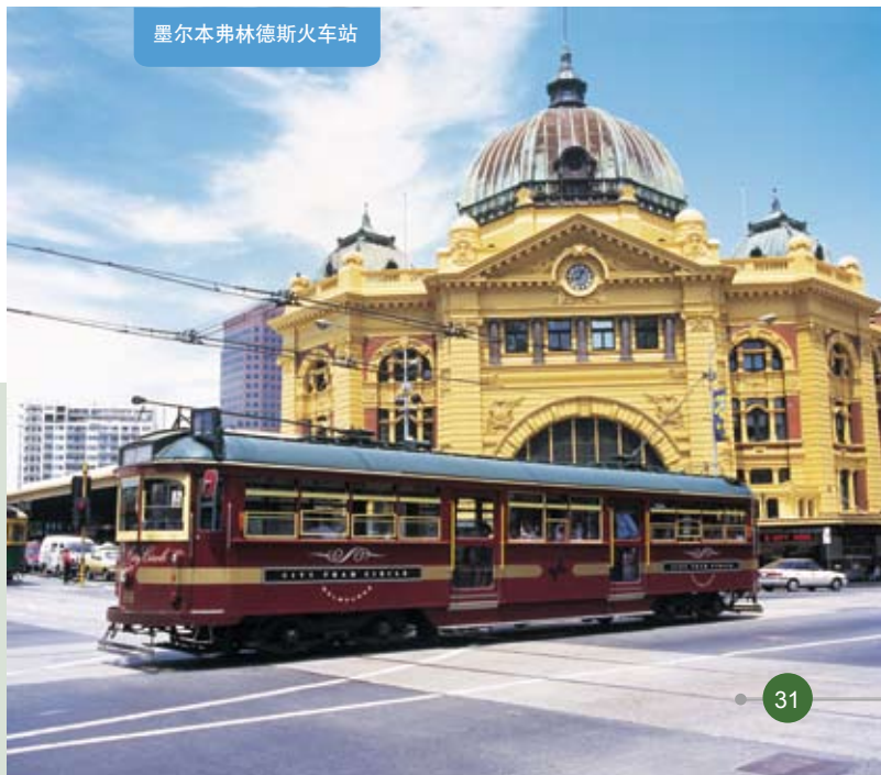
墨尔本弗林德斯火车站

在澳大利亚的大部分地区出租车都一天24小时营业。车费在出租车计费表里显示。各出租车公司都列在Yellow Pages (黄页)电话簿“Taxi Cabs”栏目下。大部分城市皆有特别为坐轮椅人士而设的出租车。