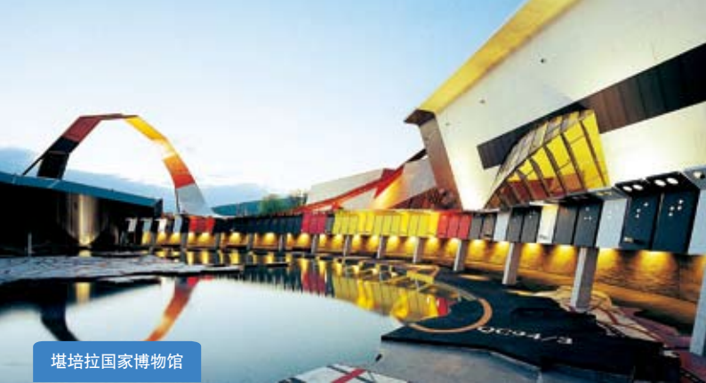
堪培拉国家博物馆