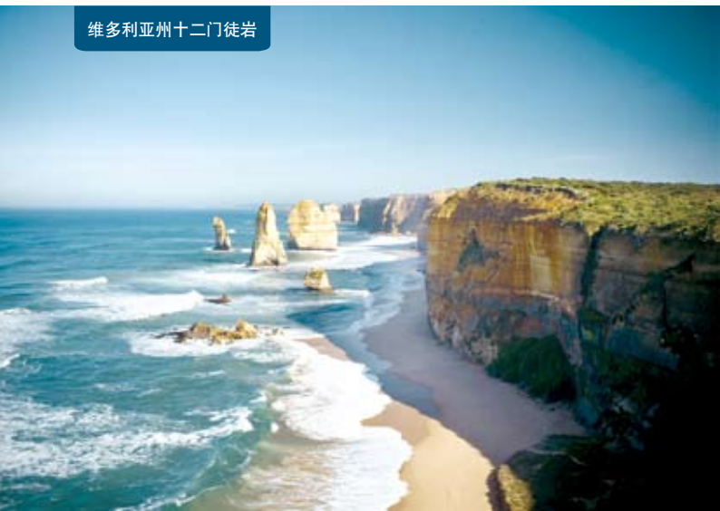
维多利亚州十二门徒岩