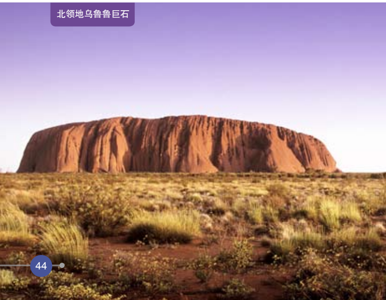
北领地乌鲁鲁巨石

中国驻外使领馆依法履行保护中国公民在海外合法权益的职责，为在国外的中国公民提供领事保护和协助是应尽的义务。但是，领事保护不能违反国际法和驻在国法律。中国驻外使领馆是国家的外交代表机构，使领馆在接受国没有行政权力和强制手段，只能通过外交途径向接受国提出交涉，既可能成功，也可能不成功。在很多情况下，使领馆的工作主要是协助当事人维护自己的合法权益，而不是代替个人主张其权利。