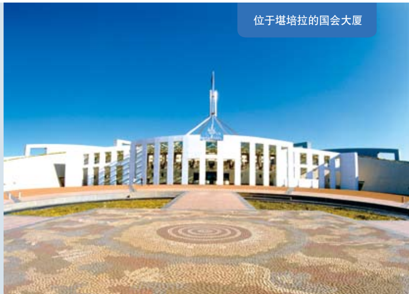
位于堪培拉的国会大厦

澳大利亚是一个后起的工业化国家，农牧业发达，自然资源丰富，盛产羊、牛、小麦和蔗糖，同时也是世界重要的矿产品生产 and 出口国。农牧业、采矿业为澳传统产业。近年来，制造业和高科技产业发展迅速。服务业已成为国民经济主导产业，占国内生产总值(GDP)80%以上。20世纪70年代以来，澳进行了一系列的经济改革，大力发展对外贸易，经济持续较快增长，在经济合作与发展组织(OECD)国家中名列前茅。