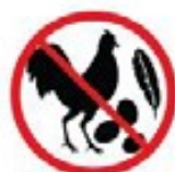
Poultry products including eggs, or feathers with skin attached