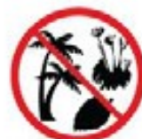
Live plants including cuttings or seedlings, or plant products made from banana, sugar cane, maize, cassava, citrus or raw cotton