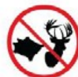
Untreated hides or skins, or other animal products