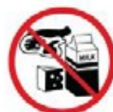
Meat or dairy products, excluding canned items